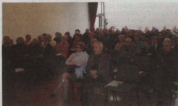
Il pubblico presente all'ultima affollata assemblea del Mutuo Soccorso