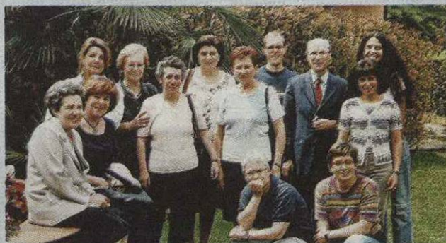
Un gruppo di volontari del Cav