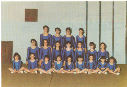
Settore Formativa Ritmica