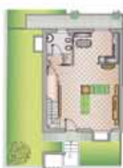
Villetta su tre livelli